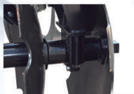
Chumacera Libre Mantenimiento

Cuenta con un sistema sencillo de nivelación o balanceo de la rastra. Dicho sistema cuenta con un tornillo que se encarga de ajustar la rastra tanto para nivelación de trabajo como transporte. Así mismo este sistema es apoyado en un balancín y una muelle de 5 hojas que equilibran y amortiguan las cargas.