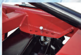
Posiciones de ángulo de ataque